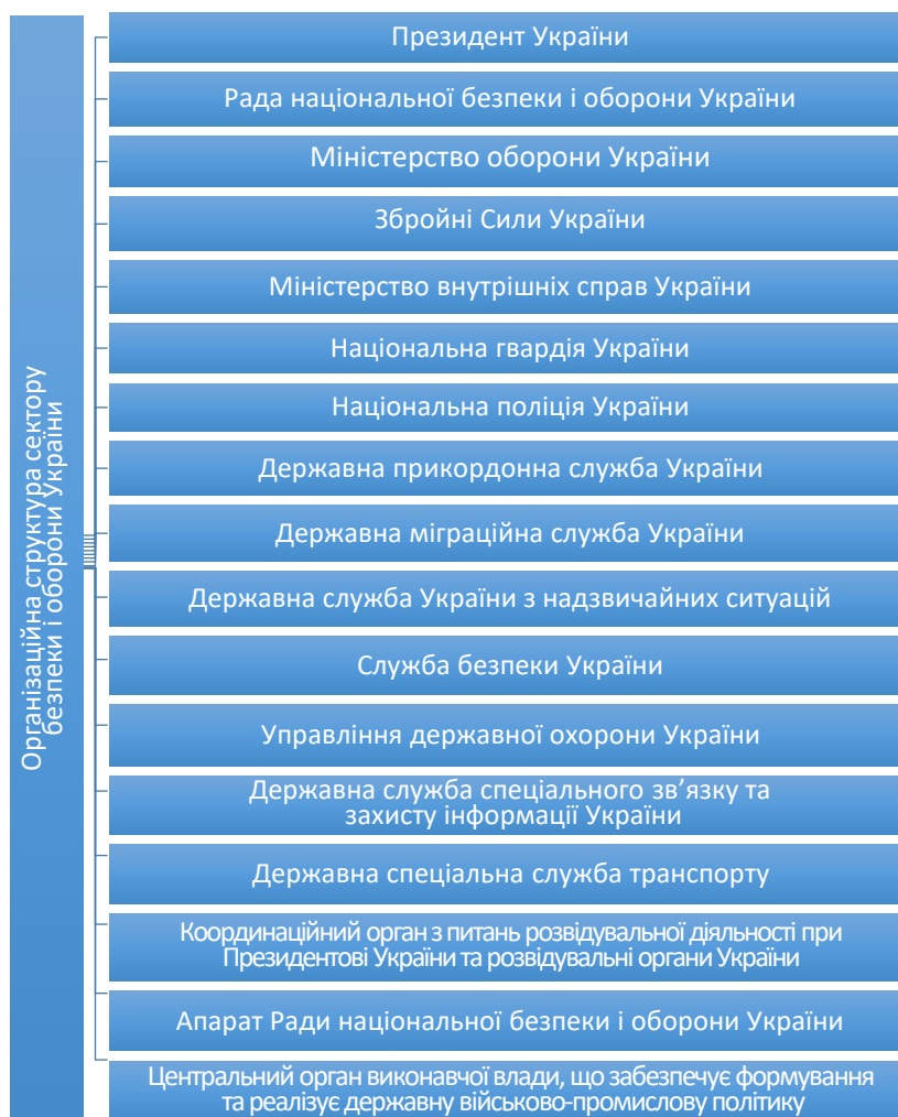
Рис. 1. Організаційна структура сектору безпеки і оборони України

Основними завданнями сектору безпеки і оборони є: оборона України, захист її державного суверенітету, територіальної цілісності і недоторканності; захист державного кордону України; захист конституційного ладу, економічного, науково-технічного і оборонного потенціалу України, законних інтересів держави та прав громадян від розвідувальної і підривної діяльності іноземних спеціальних служб, посягань із боку окремих організацій, груп та осіб, а також забезпечення громадської безпеки та охорони державної таємниці, іншої інформації з обмеженим доступом; попередження, виявлення, припинення та розкриття злочинів проти миру і безпеки людства, інших протиправних дій, які безпосередньо створюють загрозу життєво важливим інтересам України, боротьба з тероризмом, корупцією та організованою злочинністю у сфері управління і